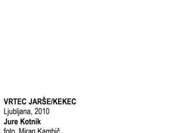
VRTEC JARŠE/KEKEC Ljubljana, 2010 Jure Kotnik